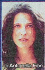
di Antonella Fiori